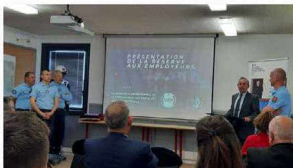
Réserve opérationnelle : les gendarmes à la rencontre des employeurs en présence du préfet Nicolas Basselier