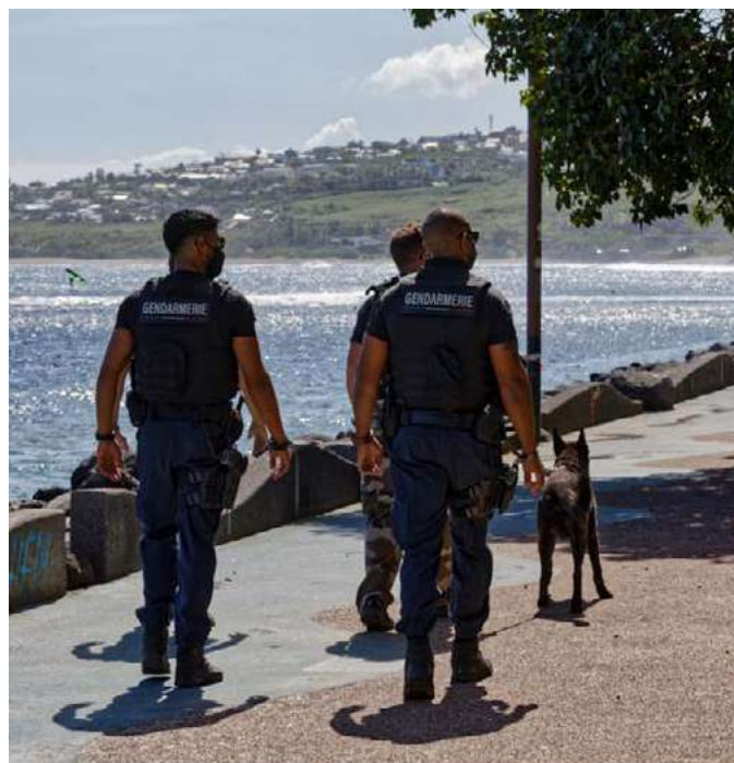
Patrouille de sécurisation

Sur la compagnie de St Benoît le PSIR est articulé soit en 2 équipes autonomes patrouillant dans les quartiers sensibles tels que Bras-Fusil, Labourdonnais ou la Réserve, soit en peloton complet dans le cadre des événements de violences urbaines ou d'ordre public. Le PSIR agit également sous réquisition du Parquet dans le cadre de la sécurisation des mobilités douces, rassurant autant les voyageurs que les agents des lignes de bus par une action déterminée.