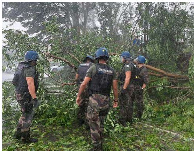
Assistance à la population

En conclusion, l'engagement des militaires du PSIR permet d'accroître la capacité opérationnelle de la compagnie de Gendarmerie départementale de Saint Benoît par la projection sur le terrain de militaires déterminés et motivés dans les zones et sur les créneaux horaires nécessitant des technicités ou des moyens particuliers. Aux côtés des gendarmes d'active des brigades